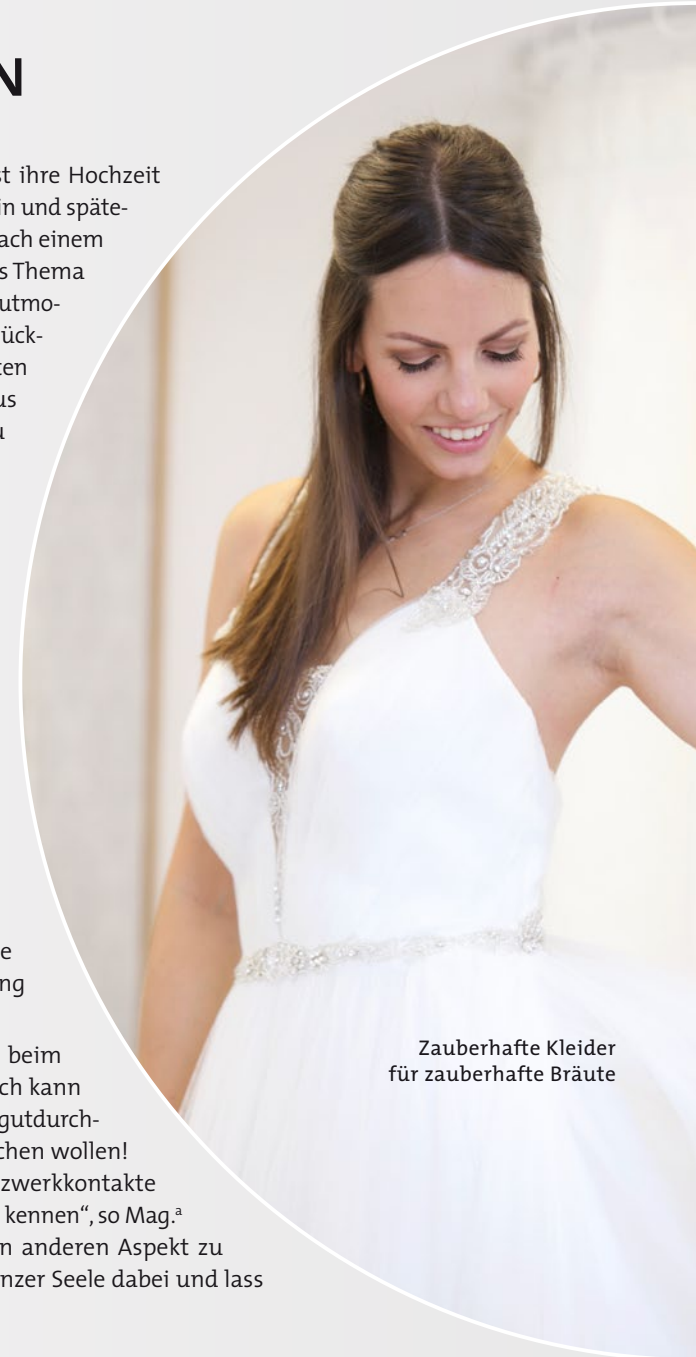
Zauberhafte Kleider für zauberhafte Bräute