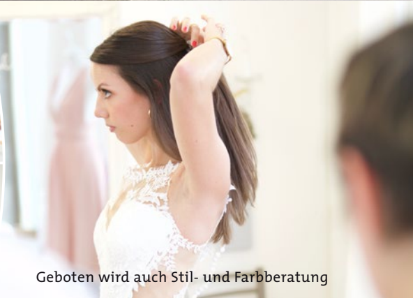
Geboten wird auch Stil- und Farbberatung